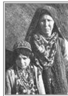
دو چهره اینچه برونی

وقت درو از اول پاییز بود و سه چهار هفته‌ای دوام داشت . با داس درو میکردند و دسته‌های درو شده را با چند ساقه شالی می‌پیچیدند و در همان شالی زار درو شده به ردیف بر روی ((سفال (sefal)) ها می‌نهادند . این دسته‌های درو شده را تا چهار پنج روز همانجا می‌گذاشتند بماند تا خشك شود . آنوقت هر ده پانزده دسته را با طناب به هم می‌پیچیدند و ((خرمنگاه)) می‌بردند و ((تایه (taye)) میکردند .