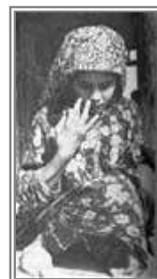
در اینچه برون ، سوزن دوزی دختران از جمله مناظری است که زیاد دیده میشود