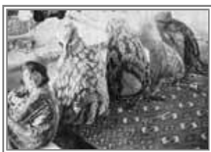
زنان و دختران اینچه برو نی بیشتر ساعات روز را به قالی بافی مشغولند

در زمستانها حال ده طرزی دیگر است ، در کنار همه خانه‌ها و آلاچیقها توده‌ای هیزم از شاخه‌های خشک گز انباشته است . مردم کمتر پیدایشان می‌شود ، صبحها و غروبها را که سردتر است تا می‌توانند توی اطاق یا آلاچیق بسر می‌برند . معهذا کارهای گوناگون روزانه دستبردار نیست . اگر مرهای پوستین پوشیده‌نی را که آفتاب می‌گیرند ندیده بگیریم ، دیگران هر يك به کاری مشغولند . مردانی که از ده بیرون می‌روند با بیلی بر دوش برای جوی کندن یا تیري برای هیزم چیدن ، پسر بچه‌هایی که در راه مدرسه کتاب و دفتر به زیر بغل گرفته‌اند ، زنهایی که بر روی پیراهنهای کم بها روپوشهای گران قیمت مخملي و سکه دوزی شده پوشیده‌اند و به کارهای خانه میرسند . اینها با همان اطاقها و آلاچیقهایی که در برخی از آنها زنان و دختران همچنان به قالیچه بافی مشغولند .