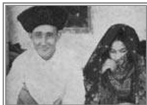
يك زوج جوان اینچه برونی

چاره اندیشی دیگرشان هم این بود که بالای اینچه برون و از رودخانه اترک نهري تا کنار تنگلی کنند و به محلی رساندند که اکنون دریاچه کوچکی شده است و آب اترک را که زمستان زیاد می‌شود در این دریاچه ذخیره می‌کنند . تا هم به زمینهای